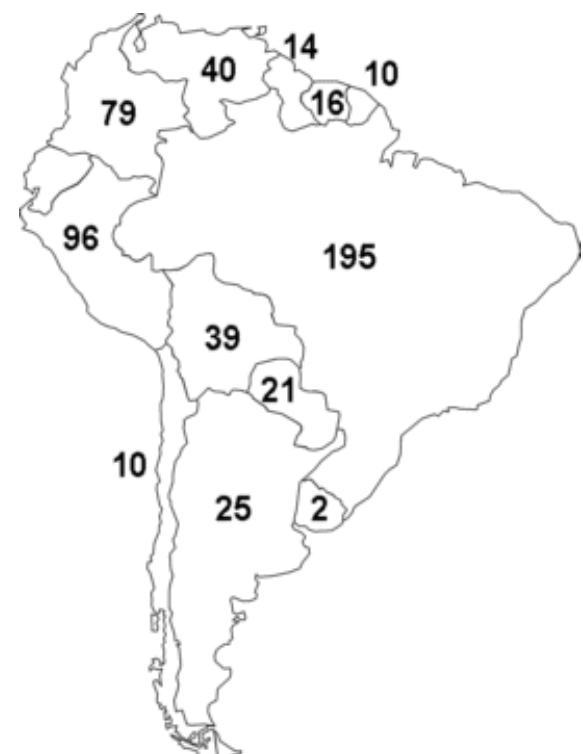
Abbildung 3 Anzahl der in südamerikanischen Staaten gesprochenen Sprachen