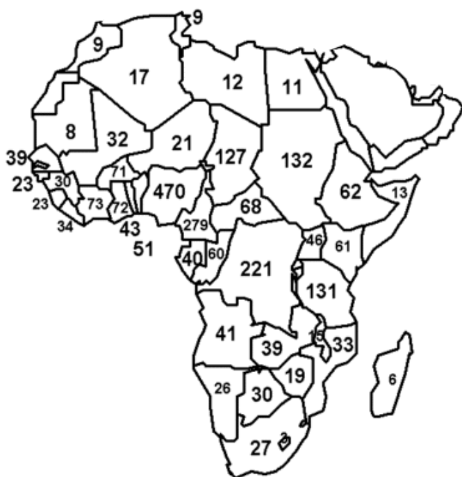
Abbildung 1 Anzahl der in den afrikanischen Staaten gesprochenen Sprachen

Die folgenden Karten geben einen Eindruck von der Vielfalt der Sprachen der Welt: